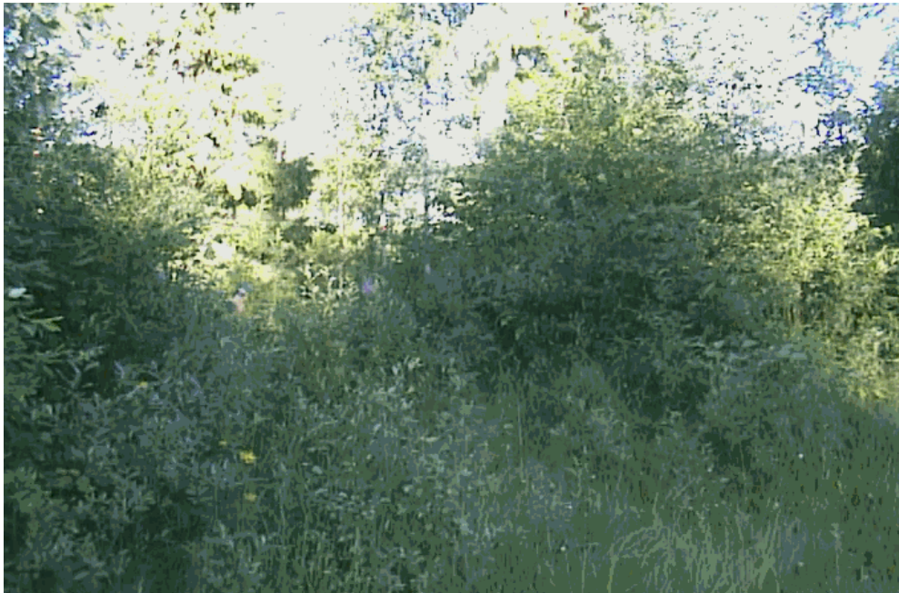
Kuva 21. Pienellä raivauksella ja ruoppauksella saadaan hyvä paikka venevalkamalle

Salmenkylältä puuttuu yhteinen venevalkama. Venevalkama olisi tarpeen, koska kalastus ja retkeilymahdollisuudet järvellä ovat rajattomat. Nykyisin järvellä voi järjestää jopa harrastaa kanoottiretkeilyä, koska järveltä on yhteys Pieliselle.