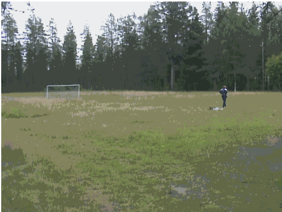
Kuva 26. Heinittynyt ja ruohikoitunut Salmenkylän urheilukenttä.

Salmenkylän entisen koulun vieressä sijaitseva urheilukenttä kaipaa pientä korjausta. Kenttä on heinittynyt melko pahasti ja siitä on tullut kuoppainen. Kentällä on aiemmin pelattu jalkapalloa sekä muita pelejä ja harrastettu muita yleisurheilulajeja. Tällä hetkellä kentän on vallanneet rikkaruohot ja heinät. Heinät voitaisiin torjua pois ja kenttä kunnostaa lanauksella. Talvisin kenttää voitaisiin jäädyttää, jolloin siihen tarvittaisiin myös kaukalon laidat. Laidat voitaisiin rakentaa kestopuusta, joten ne säilyisivät kauan. Laidat olisivat irtoneiset ja niiden laittaminen paikoilleen voitaisiin tehdä talkootyönä. Jääkiekkokaukalon saaminen Salmenkylälle helpottaisi jääkiekon parissa harrastavia nuoria sekä vanhojakin ihmisiä. Nykyisin lähin jääkiekkokaukalo sijaitsee Porokylässä.