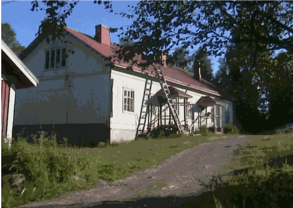
Kuva 1. Pennasenvaaran koulu on nykyisin asuttu

Salmenkylän toinen koulurakennus rakennettiin myös 1930 luvulla. 1950-1960-luvulla Ylisenvaarassa oli peräti kaksi kyläkauppaa. Tällä hetkellä Ylisenvaarassa ei ole kauppoja niin kuin ei myöskään Salmenkylässä. Salmenkylän Jukolan kauppa lakkautettiin vuonna ? Verkkopuron yläjuoksulla on ollut vesimylly 1930-50 luvulla. 30-luvulla myllyssä on jauhettu viljaa ja 50-luvulla myllyssä on tehty päreitä.