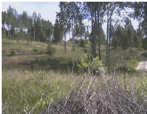
Kuva 5. Näkymä ylisenvaaralle.