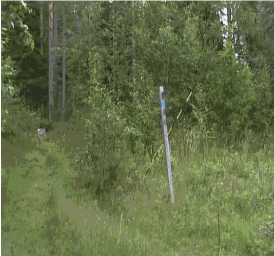
Kuva 27. Yksi UKK-reitin osa.

Salmenkylällä on monenlaisia polkuja, joista osa on heinittynyt tai kasvanut umpeen. Salmenkylällä kulkee myös UKK-reitti. Reitistö kulkee osittain teitä pitkin Korihvaaralle asti.