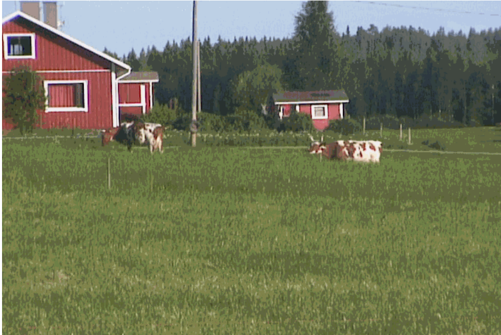
Kuva 8. Pihapiiriin kuuluu myös lehmät.