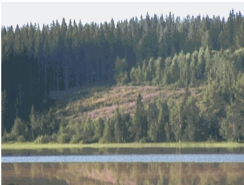
Kuva 15. Metsiä on hakattu myös mäkien rinteiltä.

Peltojen vesakoitumista ei ole Salmenkylällä havaittavissa, vaan pellot ovat hyvin hoidettuja. Hakkuiden jälkeen metsien loppuraivaus jää usein tekemättä, jolloin metsät jäävät hoitamattoman näköisiksi. Järvelle näkyy muutamia suuria metsähakkuu aukkoja, joiden muokkaaminen sekä hakkaaminen olisi voinut suorittaa paremmin jättämällä esim. suojuspuita ja puusaarekkeitä.