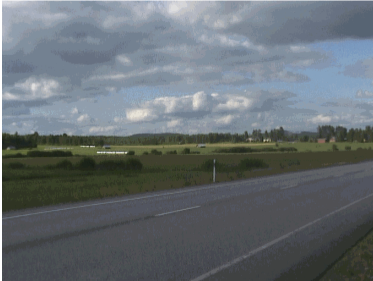
Kuva 24. Peltomaisemaa Aronsalmella.

Peltojen metsitys ei ole eduksi kylämaisemalle, koska vaaroilta alas katsottaessa moni pelto on kasvanut täyteen erilaisia pajuja ja kasveja. Tämä peittääkin hyviä näköalapaikkoja, joista ennen on näkynyt kauas. Nykyisin vaarojen pellot ovat kasvaneet täyteen pusikoita huonon hoidon vuoksi. Ennen vaarojen pellot olivat viljelyksessä, joissa kasvattiin monenlaisia viljelykasveja. Hakamaat ja vanhat niityt ovat osa kulttuurimaisemaa, ja ne tulisi säilyttää. Tarkoituksena olisi myös saada vanhat piikkilangat pois pelloilta, koska ne aiheuttavat ongelmia marjastajille ja vaeltajille.