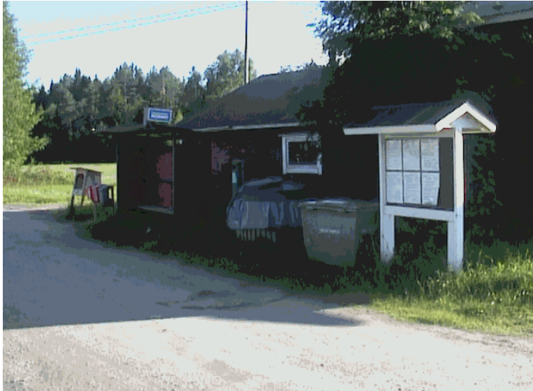
Kuva 11. Puumalaisen tienristeyksen kohdalla sijaitseva ekopiste