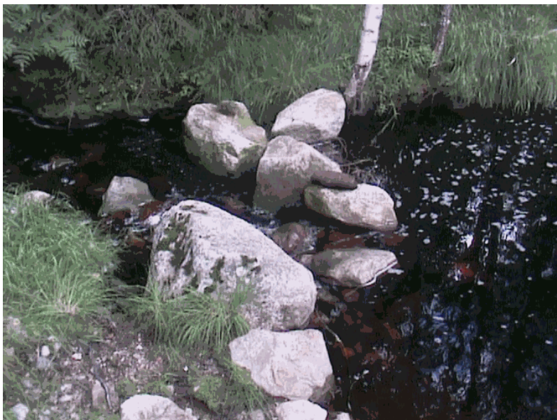
Kuva 25. Lehmipuron kuohuja.

Joidenkin lampien ympärille on paikoin kasvanut pensaikkoa, joka on joissain määrin suositeltavaa, ettei soilta tulevat ravinteet tulisi suoraan lampiin. Näin ollen pajut sitovat ravinteet, jotka muuten kulkeutuisivat purojen kautta Viemenenjärveen ja sieltä Pieliseen. Osittain lammet tulisi raivata hillitysti ja luonnollisesti maisemaa vaurioittamatta. Purot sijaitsevat melko syrjässä ja siten ne ovat luonnontilaisia.