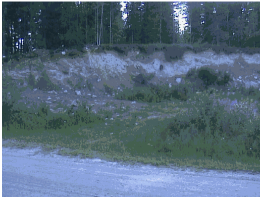
Kuva 19. Grillikatoksen paikka.