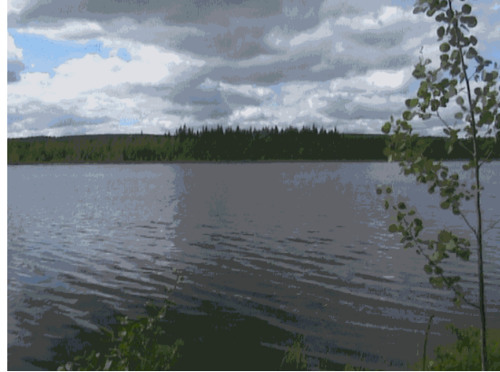
Kuva 6. Verkkojärven kaunis järvimaisema. Kuva 7. Viemenenjärven yleisin näkymä.

Salmenkylän hallitsevin elementti on vesi. Keskellä kylää aaltoilee kaunis Viemenenjärvi ja kylällä on myös paljon pieniä lampia. Salmenkylä ulottuu myös Pieliseen, joka tuo kauniin vaikutelman kylän yhteisöön. Pintavedet kulkeutuvat pääosin Viemenenjärveen purojen, jokien ja ojien kautta. Vedenlaatu järvessä on tyydyttävä, mutta rehevöitymistä on havaittavissa vuosien saatossa peltojen ylettyessä suoraan järveen. Veden väri on ruskea. Tähän ovat vaikuttaneet tietenkin monet tekijät, kuten alkuaikoina tapahtunut soiden ojitus. Soilta tulevat pintavedet kulkeutuivat usein purojen ja ojien kautta Viemenenjärveen. Tästä syystä vesi on ruskeaa. Myös maanviljelys on muokannut järvimaisemaa jo satojen vuosien ajan. Vuosisadan alussa tapahtunut lannoitus on muuttanut Viemenenjärven fosfori- että typpitasapainoa, jonka seurauksena veden laatu on muuttunut. Tämä näkyy rantojen heinittymisenä ja järvenpohjaan alkaa muodostua lietettä.