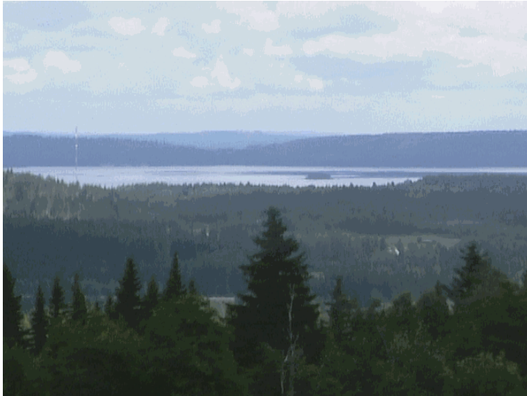
Kuva 16. Ylisenvaaralta näkymä Pieliselle.

Maiseman umpeenkasvun estäminen vaaroilta, maisemavaurioiden korjaaminen ja vanhojen kyläpolkujen sekä UKK-reitin säilyttäminen kulkukelpoisina. Samoin pyritään säilyttämään viljelysmaiseman vaihtelevuus ja niitty- ja laidunmaat ennallaan. Maisemanhoidolla pyritään säilyttämään vanhat koristekasvit pihapiirissä. Tavoitteena