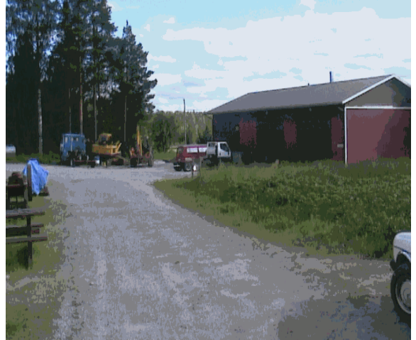
Kuva 13. Pielisen Metallin toimipaikka.