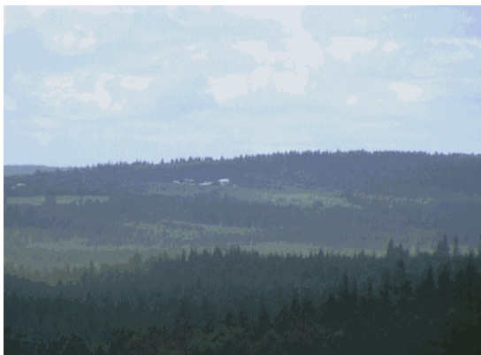
Kuva 4. Näkymä korihvaaralle.

Salmenkylän ominaispiirteeseen kuuluu kaunis järvimaisema, joka ylettyy melkein kylänrajojen pohjoispäästä eteläpäähän. Järven nimi on Viemenenjärvi. Maasto on kumpuilevaa ja tie mutkainen, joka kulkee halki kauniitten peltomaisemien läpi. Salmenkyläntie ja Viemenenjärventie muodostavat hyvät yhteydet molemmin puolin järveä. Pohjoispäässä Salmenkylää kulkeva Pennasenvaarantien yhdistää Salmenkyläntien sekä Viementien yhteen. Eteläpäässä Vimentie yhtyy Salmenkyläntiehen. Salmenkylältä löytyy myös 5 korkeaa vaaramaisemaa, joista Leiviskänkalliot ja Kärkkäisenmäki ovat 240 merenpinnasta. Muut ylisenvaara 232 m, paljakanvaara 160 m ja purnunlouhi 118 m. Salmenkylä ylettyy myös Pieliseen asti, joten Salmenkylällä on myös paljon kaunista järvimaisemaa.