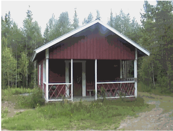
Kuva 9. Metsästysmaja