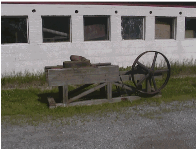
Kuva 2. Entisaikojen pärehöylä

Salmenkylän toinen koulurakennus rakennettiin myös 1930 luvulla. 1950-1960-luvulla Ylisenvaarassa oli peräti kaksi kyläkauppaa. Tällä hetkellä Ylisenvaarassa ei ole kauppoja niin kuin ei myöskään Salmenkylässä. Salmenkylän Jukolan kauppa lakkautettiin vuonna ? Verkkopuron yläjuoksulla on ollut vesimylly 1930-50 luvulla. 30-luvulla myllyssä on jauhettu viljaa ja 50-luvulla myllyssä on tehty päreitä.