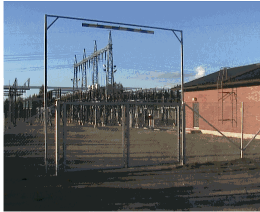
Kuva 10. Ivon muuntamo