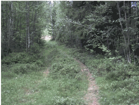
Kuva 22. Metsätie Aronsalmelle.

Metsät vaarojen rinteillä sekä peltoaukeiden välissä että Viemenenjärven rannoilla ovat yksi elementti Salmenkylän maisemassa. Niitä tulisi hoitaa oikein. Vaarojen lakipaikat tulisi säästää kaljuuntumiselta. Hakkuiden jälkeen metsät tulisi raivata. Metsiin jääneet risut, oksat ja kaatuneet puunrungot vahingoittavat aluskasvillisuuden normaalia kasvua sekä rumentavat metsän ulkonäköä. Metsän hakkuutähteet voitaisiin hyötykäyttää hakettamalla ja käyttää polttoaineena. Metsän ja pellon rajat tulisi pitää selkeinä.