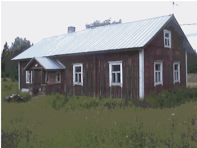
Kuva 30. Talot autioituvat myös Salmenkylällä.

Autiotaloja kylällä on muutamia. Kuitenkin nämä tilat olisi hyvä saada asutuskäyttöön. Autiotalojen kysyntä on paluumuuttajien keskuudessa kasvanut suuresti.