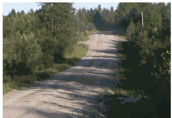
Kuva 18. Viemenenjärven kuoppainen maantie.