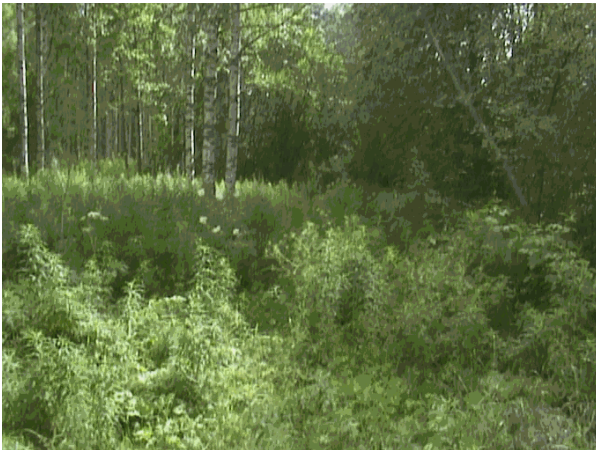
Kuva 28. Korihvaaralla kulkeva UKK-reitin osa.

Salmenkylällä on monenlaisia polkuja, joista osa on heinittynyt tai kasvanut umpeen. Salmenkylällä kulkee myös UKK-reitti. Reitistö kulkee osittain teitä pitkin Korihvaaralle asti.