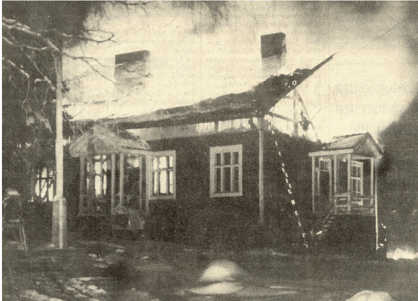
Kuva 3. Salmenkylän kyläkoulu tuhoutui lähes täysin.

Salmenkylä liittyi vesiosuuskuntaan vuonna ? Vesijohtoverkko kaivettiin Salmenkylän sekä Savikylän kanssa samassa hankkeessa. Salmenkylän toinen koulurakennus tuhoutui tulipalossa vuonna 1984. Vahingot nousivat jopa 0,5 miljoonaan markkaan.