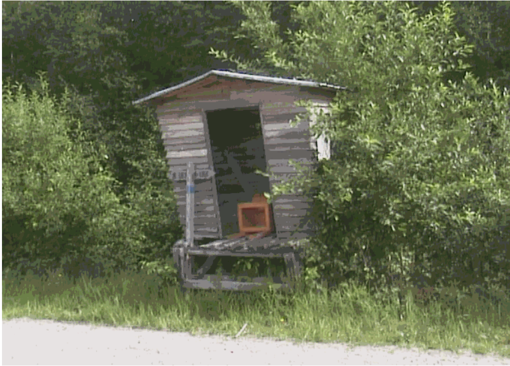
Kuva 31. Maitolaiturit ränsistyvät ja kaipaavat pikaisia parannustoimenpiteitä.

Pienet punaiset maitolaiturit rakennettiin kyläteiden varteen sodan jälkeen. Maa oli kasvussa, lehmät lypsivät ja kaupunkeja oli ruokittava. Työ oli kunniassaan. Iltaisin maitolaitureilla kokoontuivat nuoret. He ilakoivat, itkivät ja salaa suutelivat. Vanhempi väki vaihtoi kuulumisia, kun he toivat täysiä maitotonkkia lavalle. Siitä kuorma-auto kokosi ne ja vei meijeriin. Maitolaiturin yhteydessä olivat myös postilaatikat. Maitolaituri oli aikansa informaatiokeskus. Maitolaiturilla on tarvittu uskoa elämään kaikkina aikoina. Maitolaiturit eivät enää ole alkuperäisessä työssään. Mutta ilo ja suru ovat jäljellä.