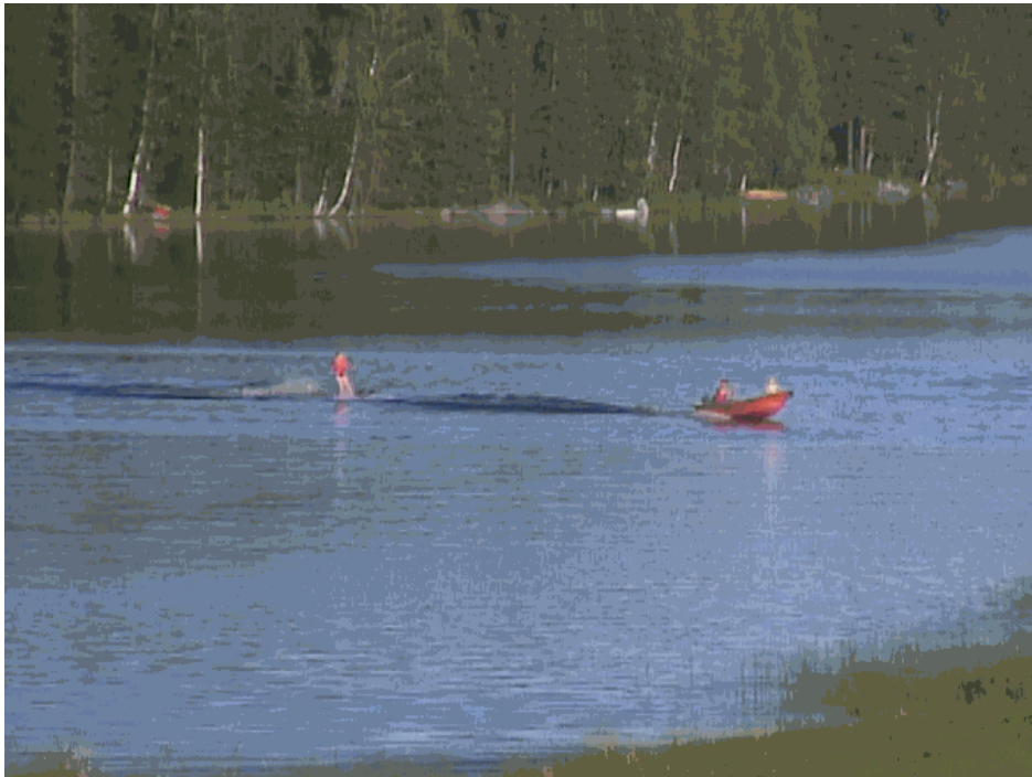
Kuva 14. Viemenenjärvellä harrastetaan myös vesihiihtoa.

Luontoharrastuksiin kuuluu mm. luontovalokuvaus, metsästys- ja kalastus, veneily, sienestys- ja marjastus, luontoliikunta, puutarha- ja metsänhoitotyöt. Salmenkylällä kulkee myös UKK-reitti, joka mahdollistaa myös vaelluksen. Eläimet kuuluvat tärkeänä osana vapaa-aikaan. Kaikenikäisten harrastuksena ovat mm. koirien-, hevosten- ja mehiläistenhoito.