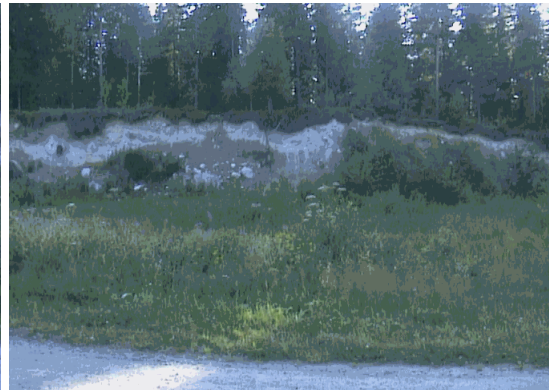
Kuva 20. Parkkipaikka autoille.

Salmenkylältä puuttuu yhteinen venevalkama. Venevalkama olisi tarpeen, koska kalastus ja retkeilymahdollisuudet järvellä ovat rajattomat. Nykyisin järvellä voi järjestää jopa harrastaa kanoottiretkeilyä, koska järveltä on yhteys Pieliselle.