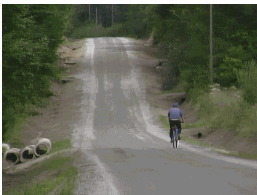
Kuva 17. Salmenkyläntien hoidetut ojat.

Salmenkylän läpi kulkevat molemmat tiet ovat heikossa kunnossa. Salmenkyläntie on osittain pinnoitettu ja Puumalaisen tienristeyksestä alkaen tie muuttuu soratieksi, joka kulkee Salmenkylän kyläkeskuksen läpi. Tien ravit on korjattu tänä kesänä mutta itse tie on kuoppainen ja näkyväisyys on huono monessakin paikassa. Muutama tienristeys on vaarallinen puutteellisen näkyväisyyden vuoksi. Tien varret ovat tiheästi vesoittuneita ja näkyväisyys on huono. Tien varsien raivaus helpottaisi näkyväisyyttä ja parantaisi näkymää Viemenenjärvelle päin. Näin tiellä kulkijat näkisivät myös kauniin järvimaiseman.