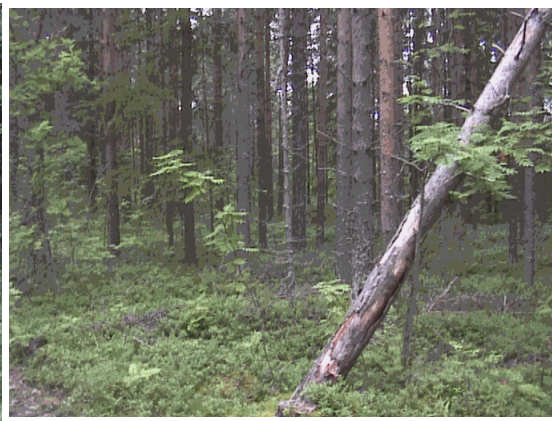
Kuva 23. Tyypillinen metämaisema.

Pensaikot tulisi raivata rajakohdista siten että metsään olisi suora ja esteetön näkymä. Näin metsät saataisiin avariksi ja moni harrastus kuten marjastus ja metsästys helpottuisi. Myös metsän hyvinvoinnin kannalta, metsien raivaus ja karsinta antavat lähes puolet tuottoisemman tuloksen. Pelloilla sijaitsevat metsäsaarekkeet tulisi myös säilyttää, koska ne toimivat suojapaikkoina eläimille suurilla peltoaukeilla ylittäessä. Myös pieneliöstö hyötyy metsäsaarekkeista, joka on erittäin tärkeä. Erityisesti tulisi välttää suurien hakkuuaukioiden tekemistä Viemenenjärven rantaan. Rantaan tulisi jättää ainakin muutama suojuspuu tai metsäaukolle pieniä puusaarekkeita, joten metsäaukio ei pilaisi järvinäkymää. Nykyisin kaupungeissa toimii myös hakettajia, jotka keräävät oksat ja risut pois ilman erillistä maksua. Tämän jälkeen metsäaukiolle on helpompi istuttaa taimia, koska risut eivät ole tiellä.