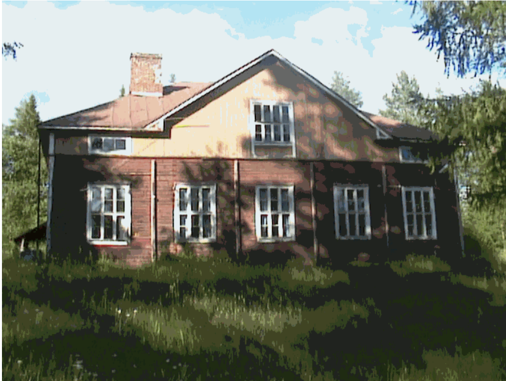
Kuva 29. Nuorisoseurantalo alkaa haurastua ja lahota ilman korjausta.

Vesikatto on uusittava, koska pitävä katto on ensimmäinen edellytys rakennuksen säilymisen kannalta. Vuonna 1977 laitettu kattuhuopa on huonossa kunnossa. Kattuhuopa on asennettu aikaisemmin huopakatteen päälle, jonka alla on vaha pärekate. Katto vuotaa taitteiden kohdalta ja tuulisella säällä vesi tippuu taitteiden kohdalta suoraan sisälle. Sadeveden roiskuminen seinille tulisi estää esim. asentamalla rännit ja syksytorvet.